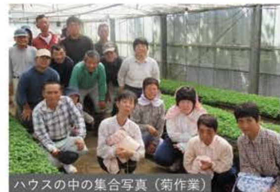
ハウスの中の集合写真（菊作業）

障害福祉サービスを利用して、支援を受けながら働く事を 福祉的就労 と呼びます。障がいを持つ仲間たちが、さまざまな働き方で仕事をしています。