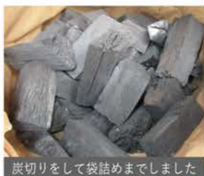
炭切りをして袋詰めまでしました