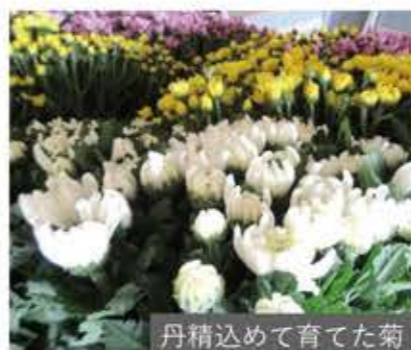
丹精込めて育てた菊

良品、安価、無料配送 10俵以上値引あり 菊 (1束 10本) 500円 良品、長持ち