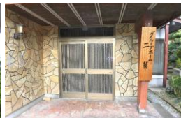
グループホーム “二葉”